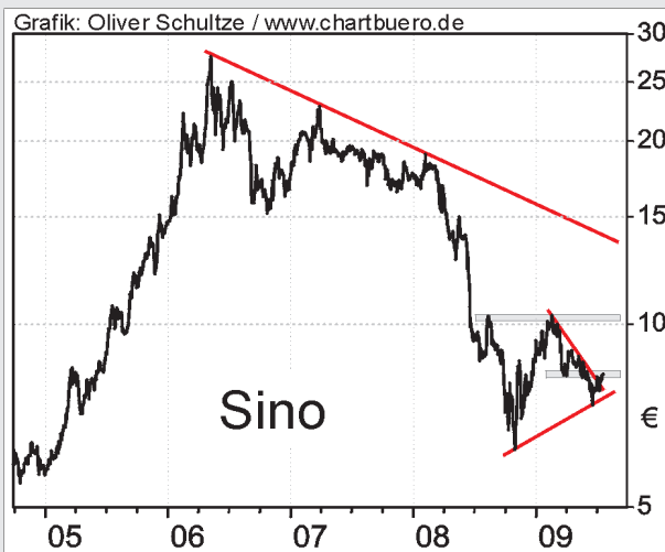
Im schwierigen Umfeld behauptet sich sino momentan gut