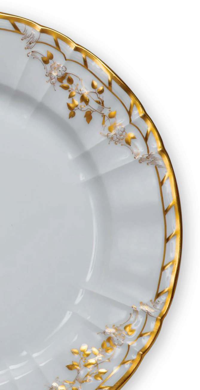
TELLER, STAATSBANKETT DER BRD KÖNIGLICHE PORZELLAN MANUFAKTUR (KPM) BERLIN, UM 1985