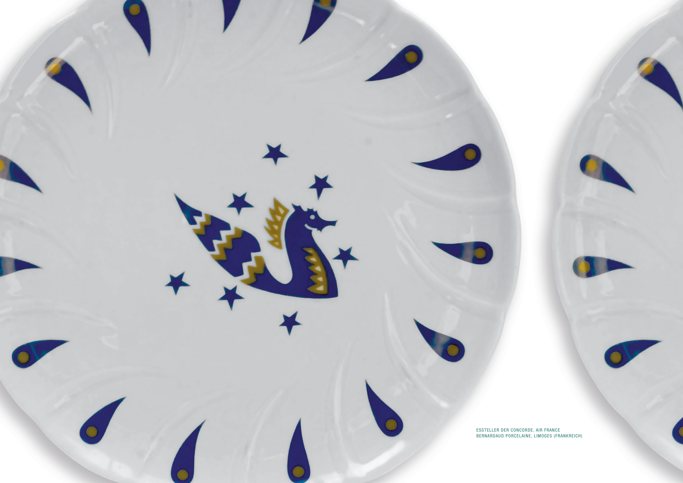
ESSTELLER DER CONCORDE, AIR FRANCE BERNARDAUD PORCELAIN, LIMOGES (FRANKREICH)