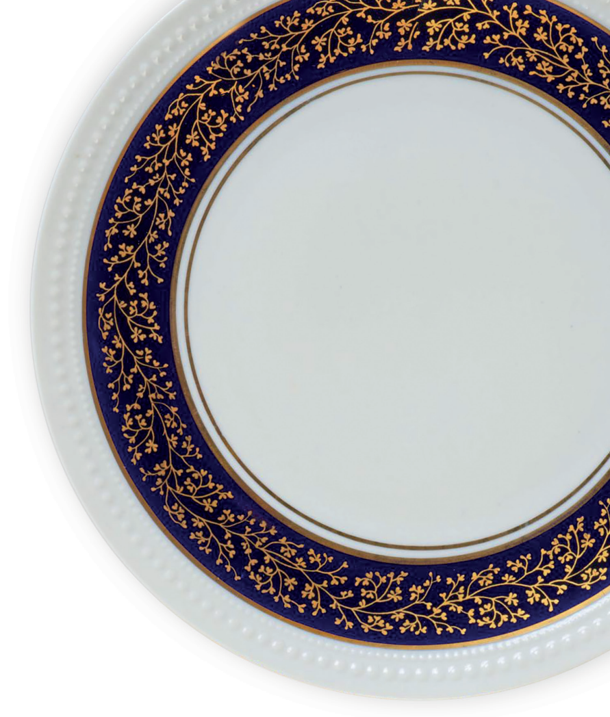
TELLER, STAATSBANKETT DER DDR GRAF VON HENNEBERG PORZELLAN ILMENAU, UM 1970