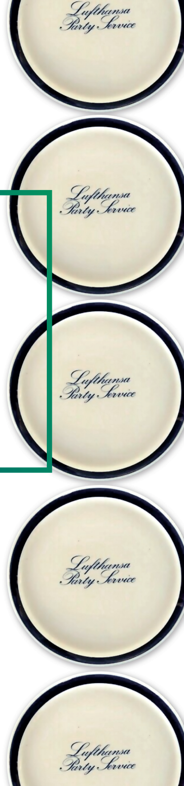
LUFTHANSA BORDGESCHIRR ROSENTHAL, SELB, UM 1950