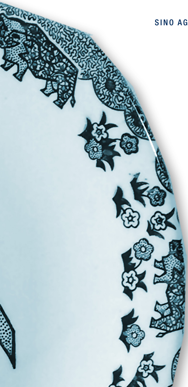
STEAK-TELLER „BEEFEATER“ ENGLISH IRONSTONE POTTERY LTD. (UK), UM 1970

SINO AG | HIGH END BROKERAGE | ERNST-SCHNEIDER-PLATZ 1 | 40212 DÜSSELDORF | WWW.SINO.DE