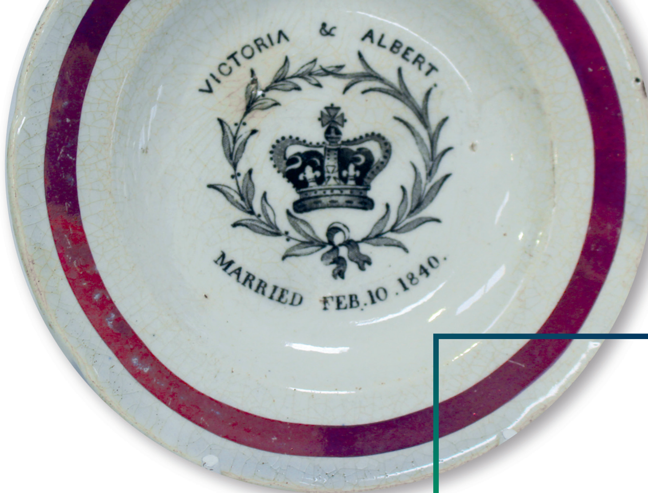
GEDENKTeller ZUR HOCHZEIT VON KÖNIGIN VICTORIA UND PRINZ ALBERT LONDON, 1840