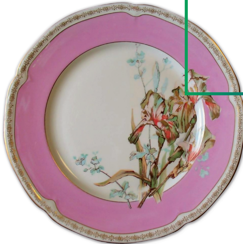
DINNER-TELLER, WALDORF ASTORIA HOTEL NYC LAMBERTON SCAMMELL CHINA (USA), UM 1930

KONZERNEIGEN- KAPITALSPIEGEL ZUM 30. SEPTEMBER 2021