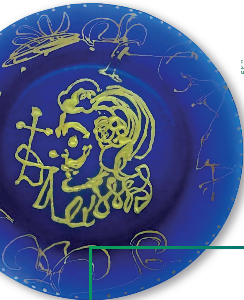
GLASTELLER „TRIOMPHALE“ SALVADOR DALÍ, 1970 MANUFACTURE DAUM, NANCY (FRANKREICH)