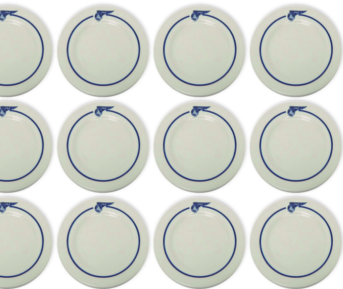
PORZELLAN-BORD-SERVICE DER PAN AM AIRLINES WALKER CHINA (USA), UM 1960

sino AG auf die Geschäftspolitik der tick Trading Software AG mehr unterstellt werden kann.